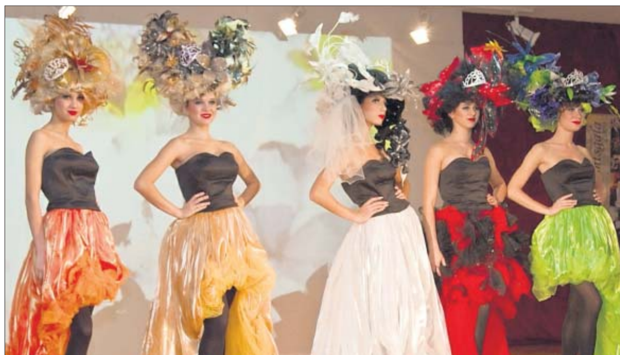
Russian-Fashion: Perfekte Performance und Stilempfinden, auch das ist eine Facette des „neuen Russland“.