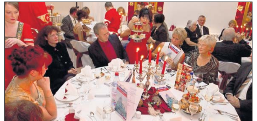
Tafelfreuden: Nicht nur das Menü, auch das Ambiente entsprach dem Thema.

■ Wer die Gäste aus Kursk live erleben möchte, ist heute um 14 Uhr in die Berufsschule Hildburghausen eingeladen. Dort werden sie eine Dankeschön-Abchiedsvorstellung geben.