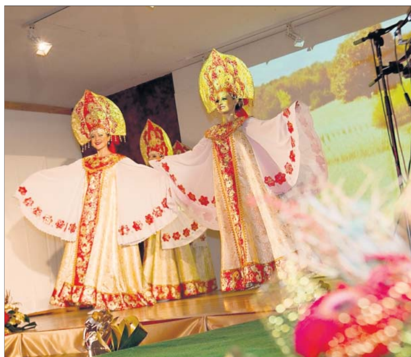
Folklore aus tiefster Seele: Alle Erwartungen wurden weit übertroffen.