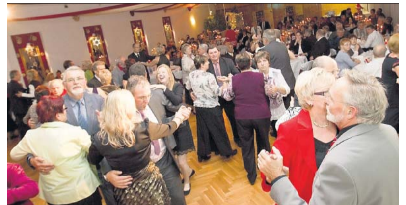
„Alles Walzer!“. Selbstverständlich kam ein russischer Walzer aufs Parkett.