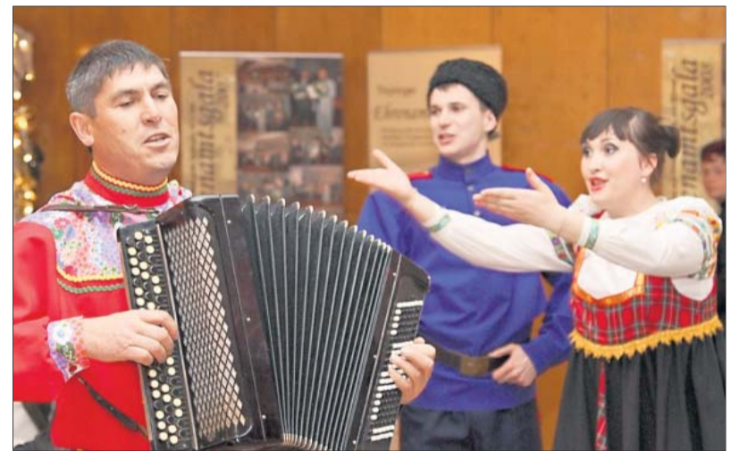
Musikalische Klassiker: ...weckten Erinnerungen und verlockten zum Mitsingen.