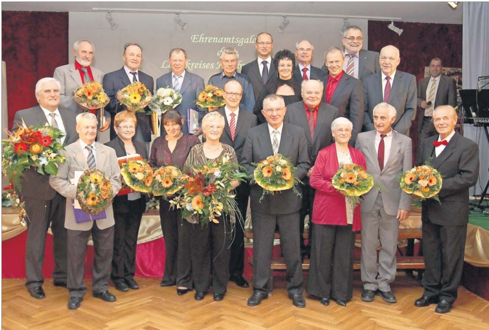
Gala-Finale: Natürlich gehört das obligate Gruppenbild aller geehrten Ehrenamtlichen dazu.