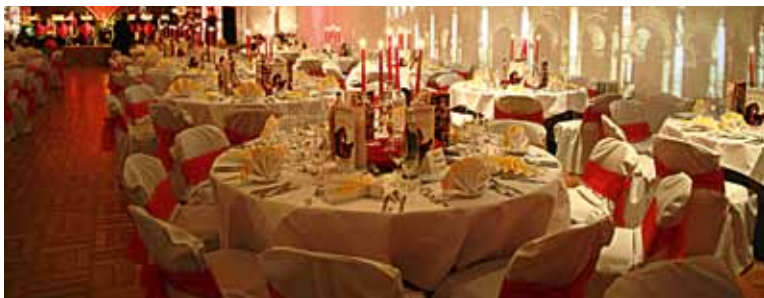
Saalambiente von der Ehrenamts gala 2010.

Unterstützung und Würdigung freiwilligen ehrenamtlichen Engagements von Firmen, Vereinen und Bürgerinnen und Bürgern des Landkreises Hildburghausen im Rahmen der diesjährigen Ehrenamts gala