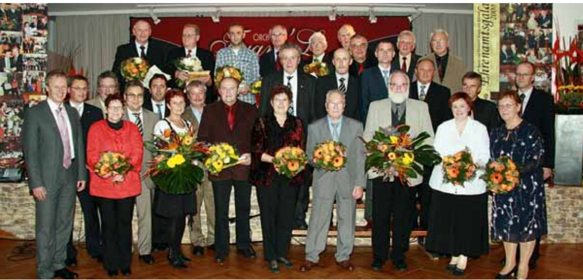
Ehrenamts gala 2010 in Schnett.